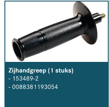
Zijhandgreep (1 stuks) - 153489-2 - 0088381193054