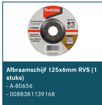
Afbraamschijf 125x6mm RVS (1 stuks) - A-80656 - 0088381139168