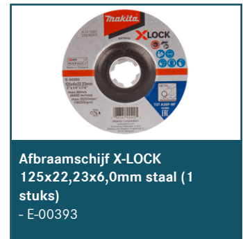
Afbraamschijf X-LOCK 125x22,23x6,0mm staal (1 stuks) - E-00393

Dit is slechts een kleine greep uit het ruime assortiment. Kijk voor alle accessoires/verbruiksartikelen in de Catalogus of op www.makita.nl .