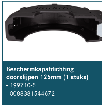
Beschermkapafdichting doorslijpen 125mm (1 stuks) - 199710-5 - 0088381544672