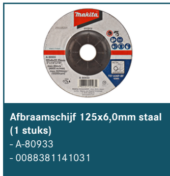
Afbraamschijf 125x6,0mm staal (1 stuks) - A-80933 - 0088381141031