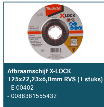
Afbraamschijf X-LOCK 125x22,23x6,0mm RVS (1 stuks) - E-00402 - 0088381555432